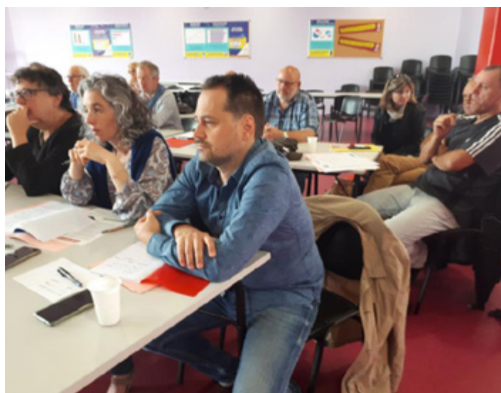
Le métier s'est complexifié et judiciarisé, une formation à la hauteur devrait être dispensée.