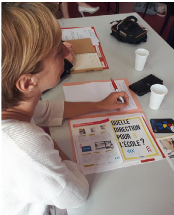
Dans les situations de conflit notamment avec des parents, la direction se sent souvent peu soutenue par sa hiérarchie.